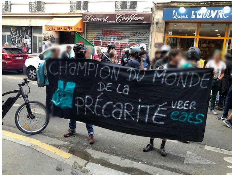
Manifestation des coursiers à Paris organisée par le Collectif des Livreurs Autonomes Parisiens (CLAP) le 19 octobre 2018

Les plateformes qui les emploient ne connaissent plus de frontières, alors les coursiers à vélo issus de 12 pays européens qui livrent les repas notamment pour Deliveroo ou Ubereats ont lancé vendredi 26 octobre à Bruxelles leur Fédération transnationale des coursiers. Ils veulent se battre ensemble pour un salaire horaire garanti et la transparence des données des plateformes.