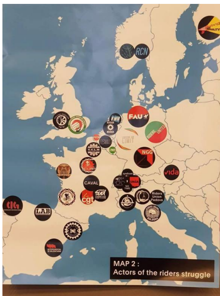
Les collectifs et syndicats présents et membres de la Transnational Courier Federation

Partout en Europe des collectifs de coursiers s'auto-organisent pour lutter contre le recul social qu'est l'ubérisation.