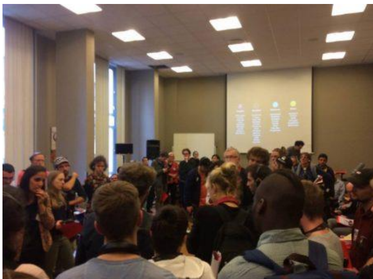
Couriers discuss their demands

The details of how the Federation will be run on a day to day level, along with its charter and ethos (which future organisations seeking to join would need to abide by) were left for future discussions to be held after the summit, but to close a series of key demands were agreed from all present, which member organisations would seek to secure from their employers: