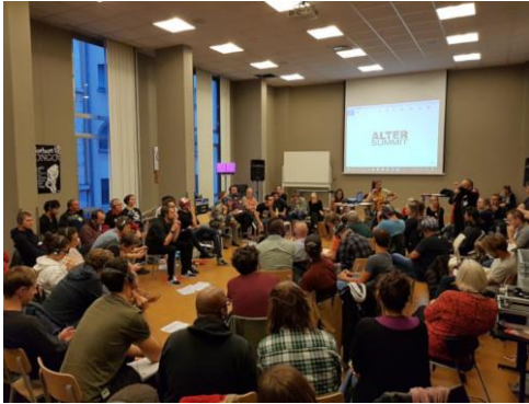
Forza lavoro. Un'assemblea con i ciclo-fattorini di dodici paesi ha deciso la costituzione della prima federazione transnazionale contro Uber, Foodora e Deliveroo. Il controattacco è basato sui diritti, salari e solidarietà collettiva e europea

Dal cuore dell'Europa è stata lanciata una sfida a Deliveroo, Ubereats, Glovo e Foodora: sessanta lavoratori delle piattaforme di delivery , organizzati localmente in collettivi o in sindacati e provenienti da dodici paesi (Austria, Belgio, Finlandia, Francia, Germania, Irlanda, Italia, Norvegia, Olanda, Spagna, Svizzera e Regno Unito) si sono trovati a Bruxelles per un'assemblea che ha dato vita alla prima federazione transnazionale dei riders (Transnational Federation of Couriers).