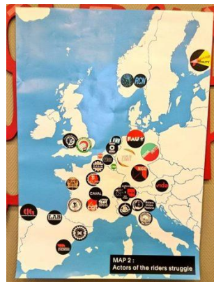
Map detailing all organisations from across Europe attending the summit

It was very well organised, with live translation into English, French, Spanish and German. The vast majority of courier groups present were self-organised collectives, independent of union influence. Other syndicalist unions (alongside the IWW) were present, notably Deliverunion (partnered with the German, FAU) and Syndicom. The Germans and Austrians were partnered with larger unions, along with Norwegian riders. Debate between couriers was held horizontally and was very good natured. Considering the fact that it was taking place in 4 languages simultaneously, the event was very effective in communicating shared goals!